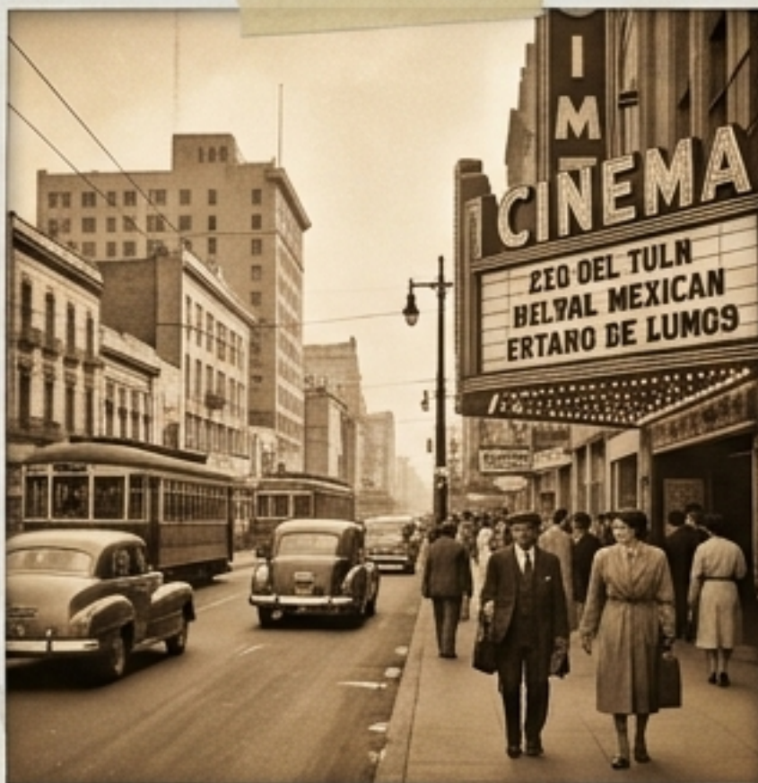
LOS 1940S – LA PANTALLA DE PLATA

Urbanización en marcha. La "Época de Oro del Cine Mexicano" domina la cultura. La "Unidad Nacional" reemplaza el discurso de lucha de clases para evitar fracturas durante la guerra.