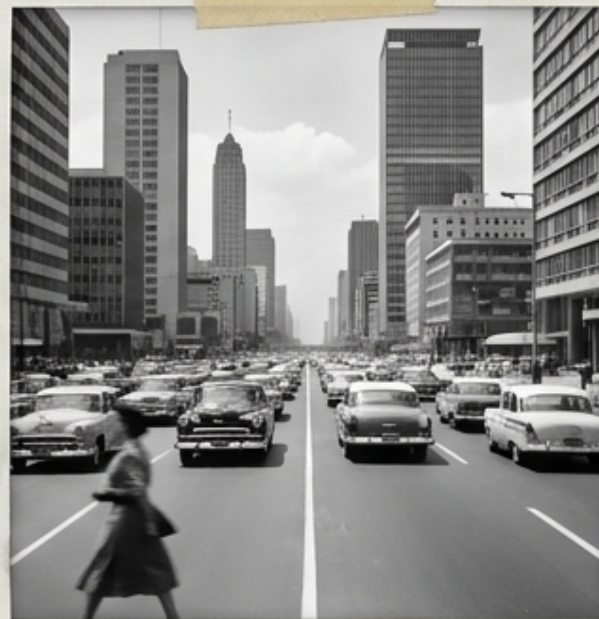
LOS 1950S – EL ASFALTO COSMOPOLITA

La Ciudad de México crece exponencialmente. Velocidad y lujo: surgen el Viaducto, Avenida Insurgentes y las mansiones de la nueva élite en el fraccionamiento del Pedregal.